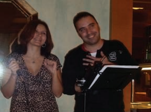
«Русский Стиль» в Германии