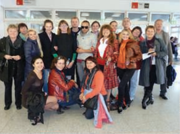
«Русский Stil» в Германии