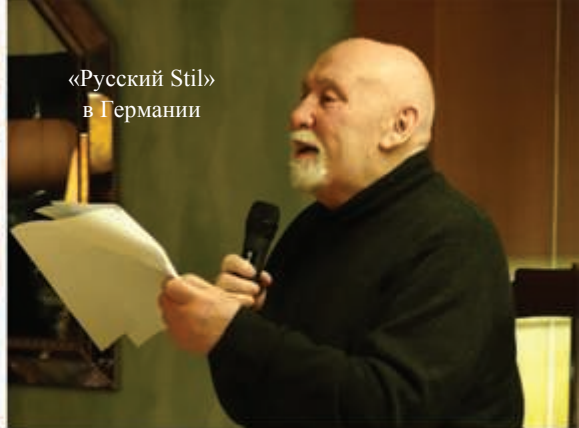
«Русский Stil» в Германии